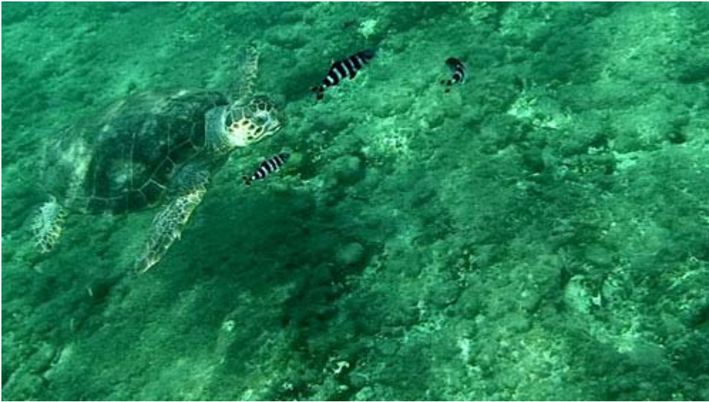
La tartaruga marina accompagnata da pesci pilota.

Per me si è trattato di un'avventura straordinaria. Il motivo per il quale queste intriganti abitatrici marine sono comparse proprio qui, rimane ancora un mistero; non ho potuto risolverlo nemmeno dopo ore al computer cercando su internet. Ora sto pensando di fare un video sulle "TARTARUGHE D'ACQUA DOLCE E TARTARUGHE MARINE DEL PELOPONNESO".