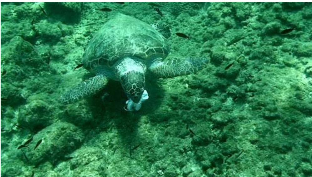
Una tartaruga marina comune mentre sta mangiando un polipo sulla costa ovest del Peloponneso.

Ulteriori spezzoni dei film di Eric Egerer li trovate su Youtube: http://www.youtube.com/user/egererfilm .