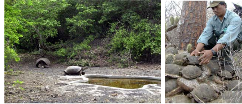
Abb. 5 und 6: Auch die Jungtiere dieses, in einem neuen Gehege in Villamil lebenden Paares von G. n. guntheri werden im Alter von fünf Jahren wieder in ihre Heimatgebiete zurückgebracht.