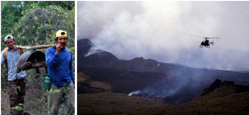
Abb. 3 und 4: Rettungsaktion am Cerro Azul. Dabei lernten die Schwergewichte die Galápagos Inseln aus einer ganz neuen Perspektive kennen.