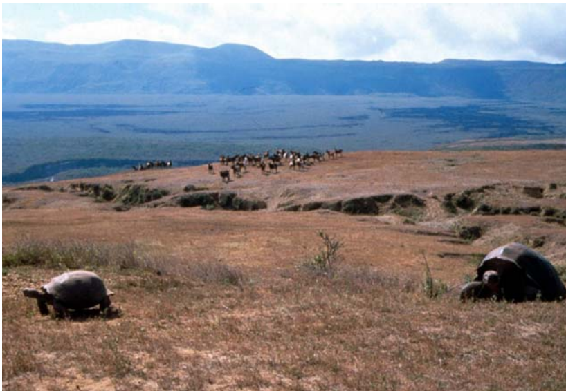
Abb. 14: Die Ziegen fressen, wie hier beim Vulkan Alcedo auf Isabela ganze Landstriche kahl und sind als Nahrungskonkurrenten eine ernste Gefahr für die Riesenschildkröten, im Bild G. n. vanderburghi .