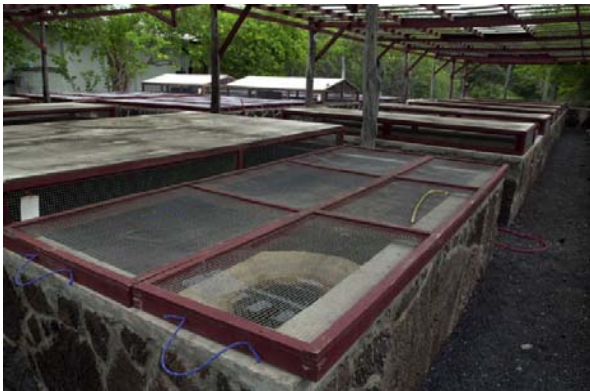
Abb. 9: Gehege in der Zuchtstation in Villamil für frisch geschlüpfte Riesenschildkröten.