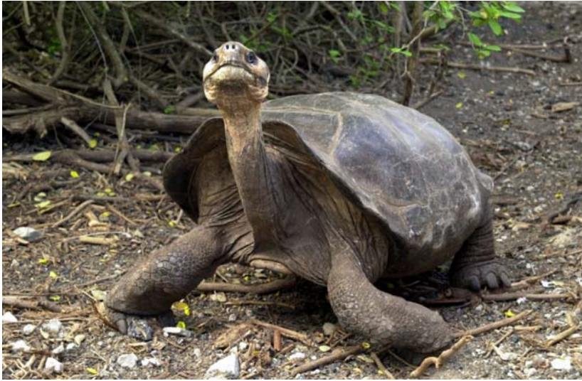
Abb. 2: G. n. guntheri in Villamil auf Isabela.