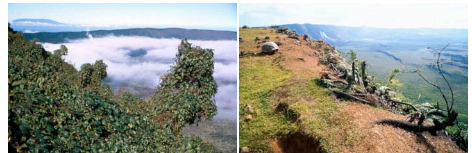
Abb. 15 - 20: Drei verschiedene Standorte auf Isabela. Die Aufnahmen sind jeweils vom gleichen Standort aus aufgenommen worden. Die Bilder links entstanden 1970 (vor Ankunft der Ziegen), die Aufnahmen rechts nach 1990.