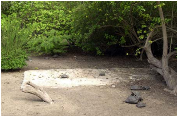
Abb. 10: Gehege in der Zuchtstation in Villamil für juvenile Riesenschildkröten.