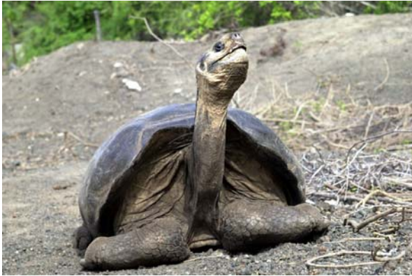
Abb. 8: Ein Weibchen von G. n. guntheri in der Zuchtstation von Villamil.