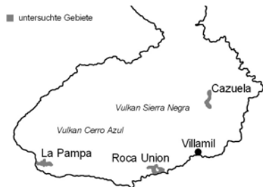
Abb 12: Gebiete im Süden Isabelas, welche bei den drei Feldexkursionen erforscht wurden.

dass die Überreste von 52 durch den Menschen getöteten Riesenschildkröten in diesen drei Feldexkursionen gefunden wurden (Tabelle 2).