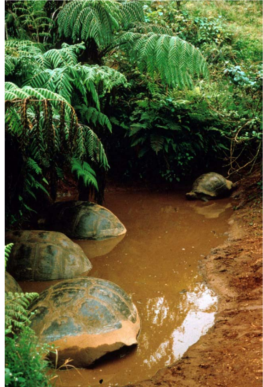
Abb. 11: G. n. vandenburghi in einer Suhle beim Vulkan Alcedo auf Isabela.