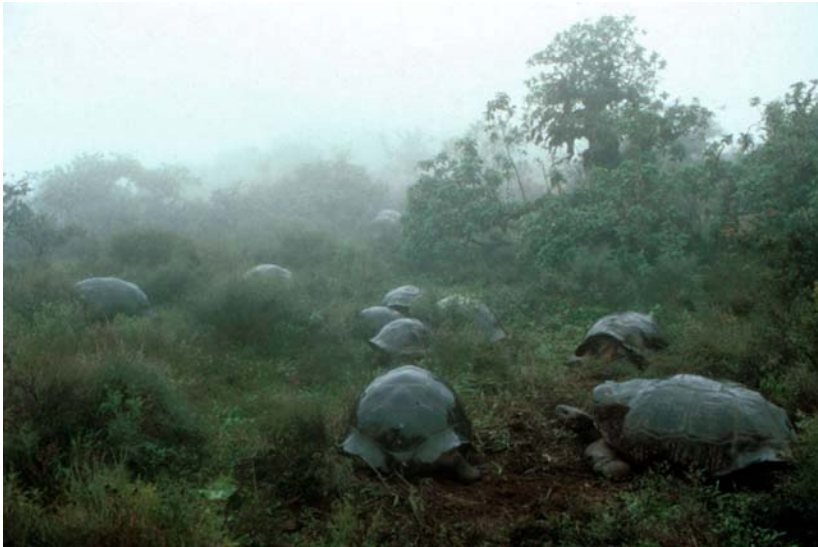
Abb. 13: Intaktes Biotop von G. n. vanderburghi am Vulkan Alcedo auf Isabela.