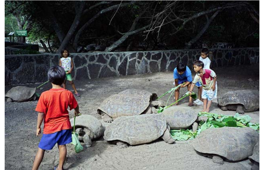
Abb. 7: Nicht immer verlief das Zusammentreffen von Riesenschildkröten und Menschen so friedlich. Dank dem Miteinbezug der lokalen Bevölkerung (hier die Mitglieder der «Amigos de las Tortugas» beim Füttern ihrer Patientiere der Unterart G. n. vicina ) in das Projekt sehen die Tiere nun hoffentlich einer gesicherten Zukunft entgegen.