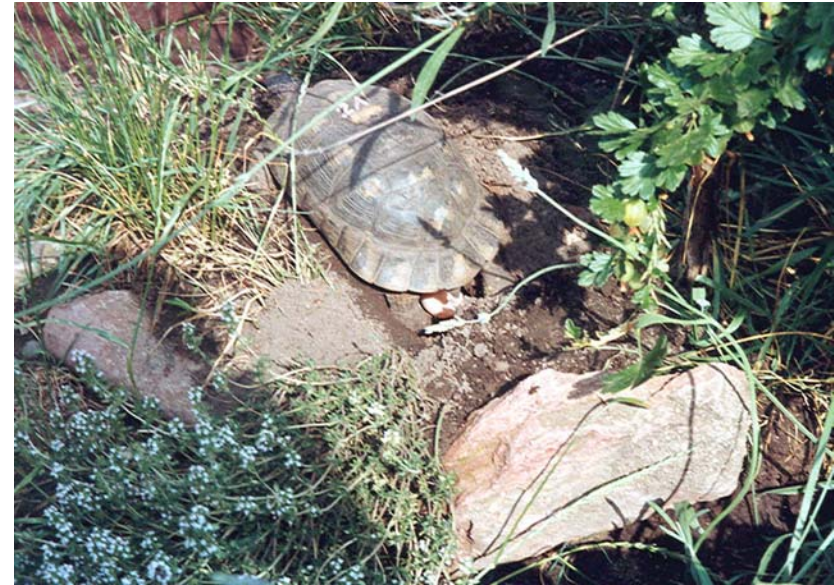
Abb. 14: Testudo marginata weissingeri bei der Eiablage