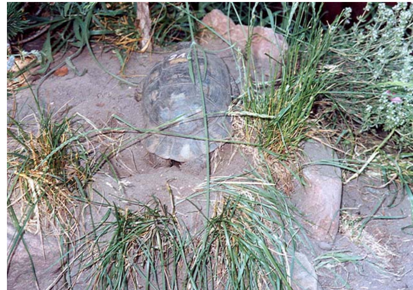
Abb. 15: Verschluss der Eigrube.