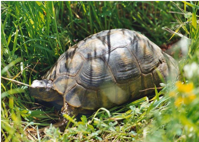
Abb. 6: Testudo marginata weissingeri , Weibchen mit 22 cm Carapaxlänge im Biotop.