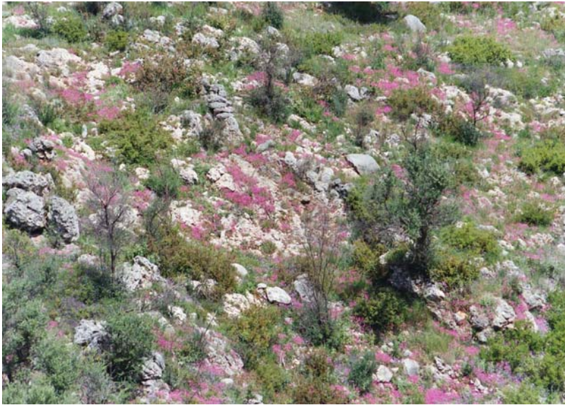
Abb. 3: Natürliches Biotop von Testudo marginata weissingeri am Westhang des Taygetos-Gebirges.