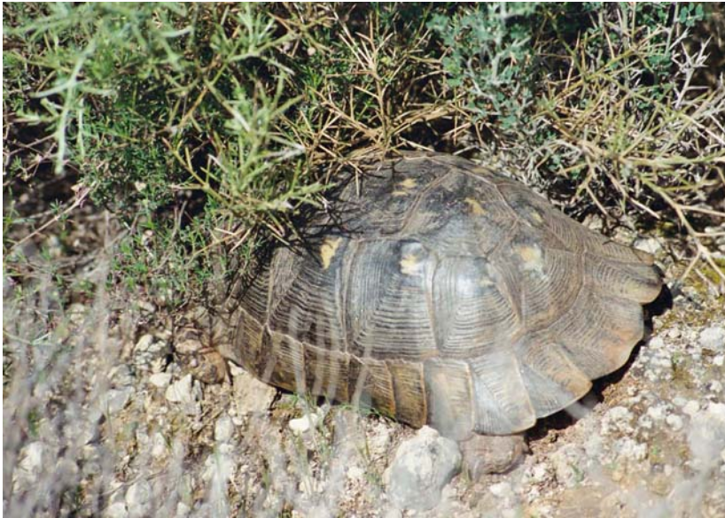
Abb. 5: Testudo marginata weissingeri , Weibchen im Biotop.