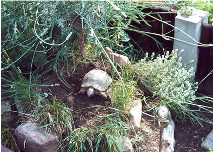
Abb. 12: Testudo marginata weissingeri bei der Suche nach einem idealen Legeplatz.