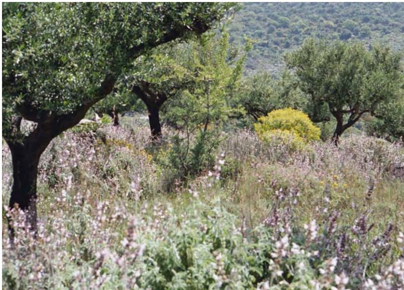
Abb. 4: Testudo marginata weissingeri besiedelt auch Olivenhaine wie diesen.