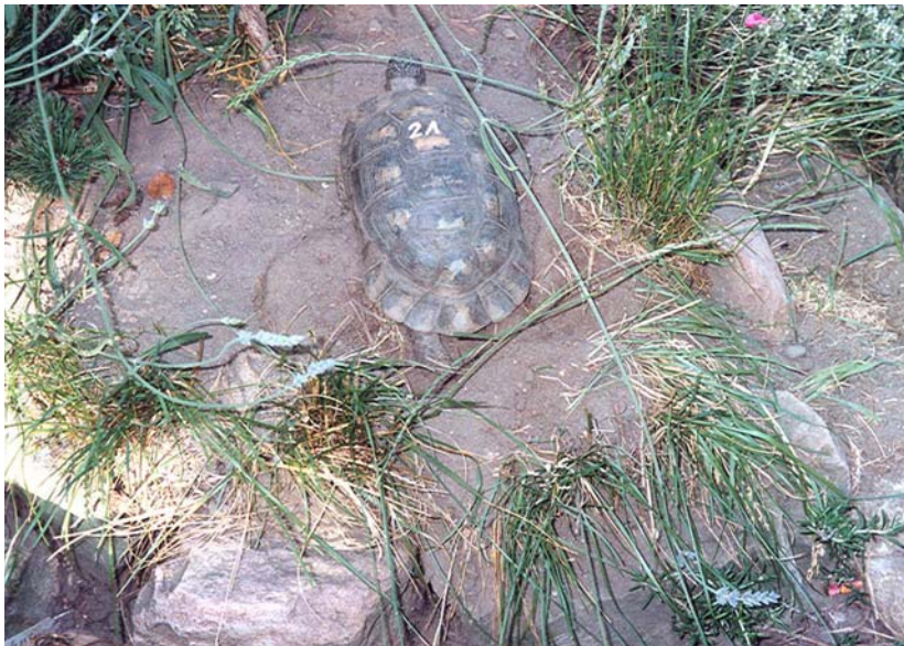
Abb. 13: Ausheben der Eigrube.