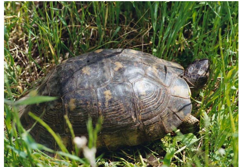
Abb. 8: Testudo marginata weissingeri , altes Weibchen im Biotop.