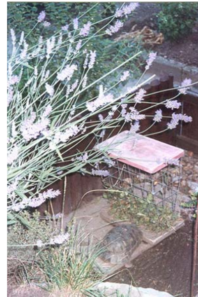
Abb. 10: Futterraufen, zur Fütterung europäischer Landschildkröten.