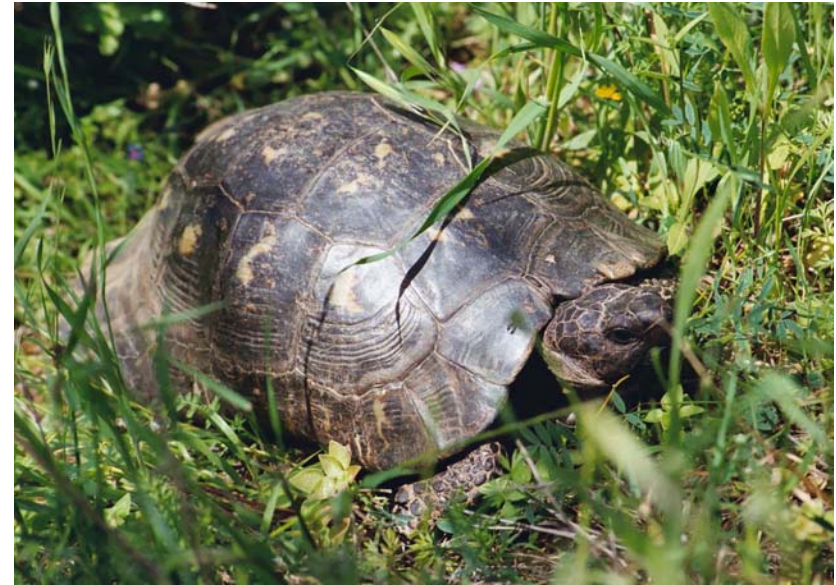
Abb. 7: Testudo marginata weissingeri , Männchen im Biotop.