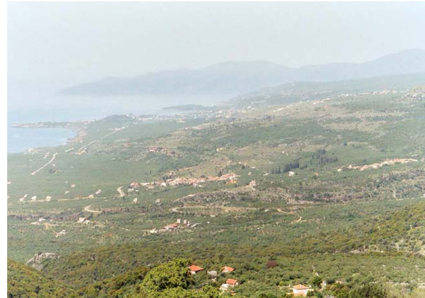
Abb. 1: Terra Typica von Testudo marginata weissingeri auf der Mani-Halbinsel am Westhang des Taygetos-Gebirges.

Die Zwergform der Breitrandschildkröte zeichnet sich durch eine geringere Körpergrösse gegenüber der Stammform aus. Die Grössenangaben für Testudo marginata weissingeri schwanken zwischen 230 mm Carapaxlänge für männliche und 215 mm für weibliche Tiere. Vom äusseren Erscheinungsbild her sind bei der Zwergform die hinteren Marginalia nicht so weit ausladend. Die hinteren Randschilder sind relativ schwach gesägt im Vergleich zur Nominatform. Was die Zeichnung des Rückenpanzers angeht, so erscheint die Carapaxfärbung matter, kontrastärmer und verschwommener. Die Areolenflecken sind weniger stark ausgeprägt, der Rückenpanzer zeigt eine braune bis graue oder mattschwarze Grundfärbung. Bei der Nominatform zeigt der Rücken-