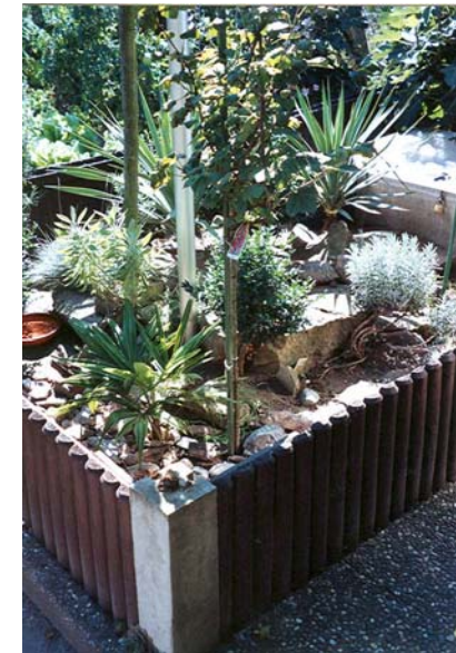
Abb. 11: Gut strukturiertes Freilandgehege zur Haltung von Testudo marginata weissingeri .

konnten bisher nicht beobachtet werden. Entsprechend der Wetterverhältnisse findet die erste Eiablage Anfang/Mitte Mai statt. In einem Abstand von etwa vier bis sechs Wochen können bis zu drei Gelege abgesetzt werden. Die Gelegegröße der Zwerg-Breitrandlandschildkröten variiert zwischen zwei und vier Eiern. Die Anzahl der Eier eines Geleges ist deutlich geringer als bei Testudo marginata marginata , die pro Gelege zwischen 5 und 12 Eier absetzen kann. Die verminderte Gelegegröße wird auch in der Literatur erwähnt (TIPPMANN, 1999).