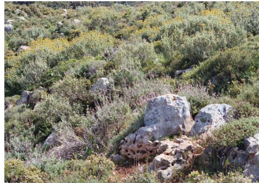
Abb. 2: Die Phrygana, typisches Biotop von Testudo marginata weissingeri .