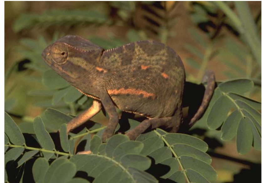
Abb. 21: Dasselbe Chamäleon wie in Abb. 20 am nächsten Morgen.