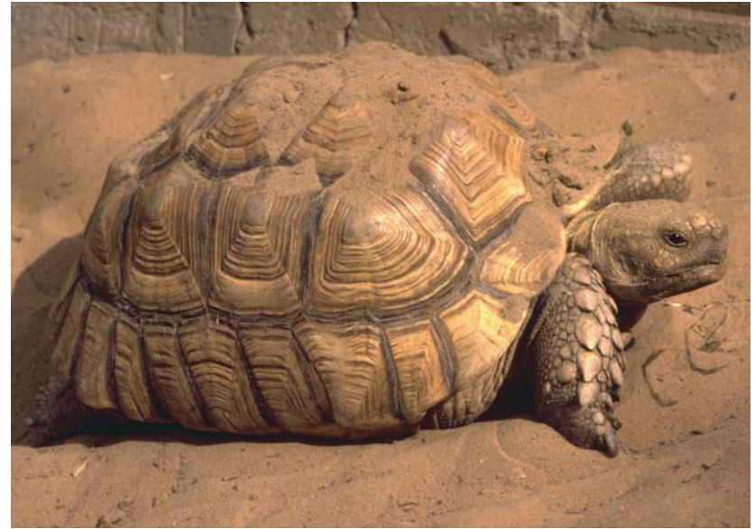
Abb. 5: Semiadulte Spornschildkröte in der Station S.O.S. Sulcata in Rufisque.