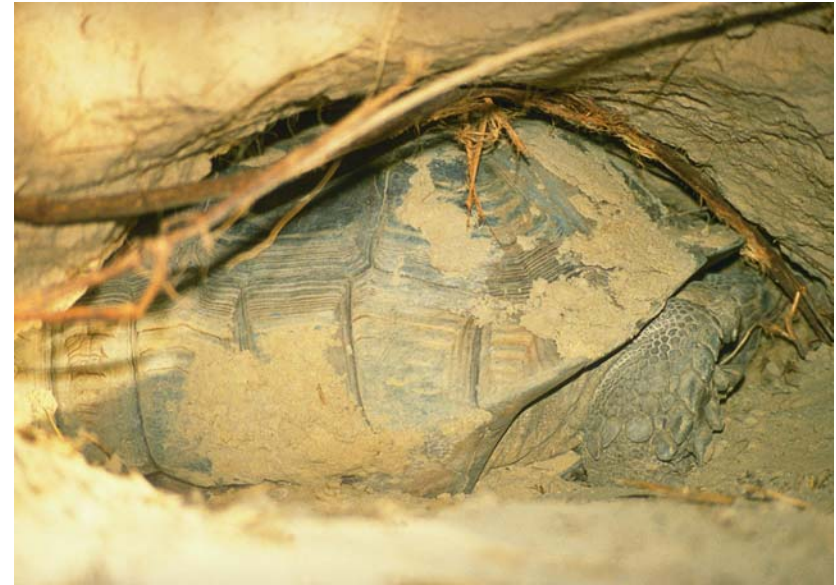
Abb. 16: Eine Spornschildkröte in ihrer selbst gegrabenen Höhle.