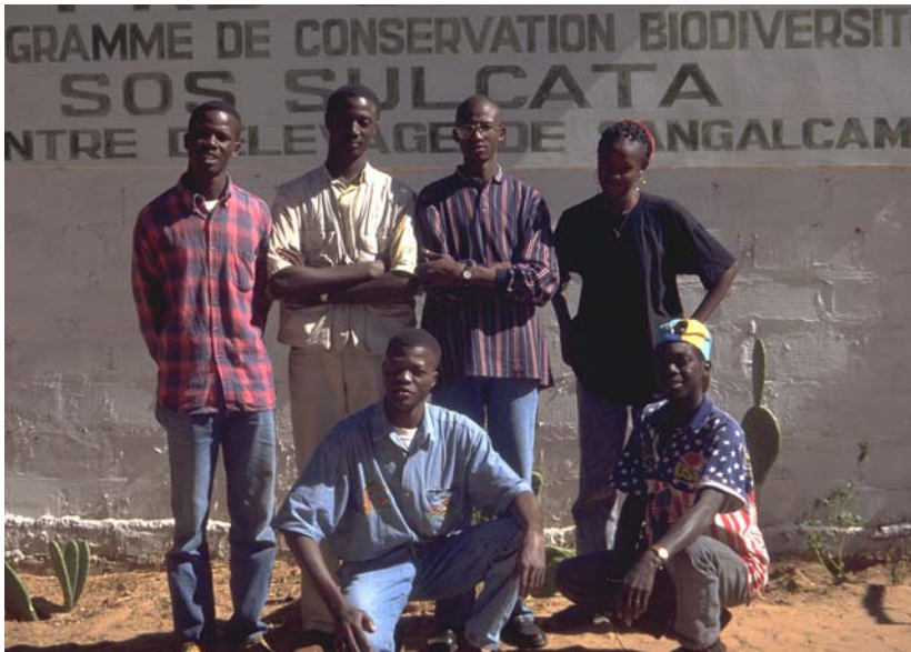
Abb. 25: Das Team von S.O.S Sulcata in Rufisque