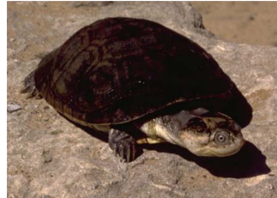
Abb. 9: Westafrikanische Klappbrust-Pelomedusenschildkröte Pelusios castaneus