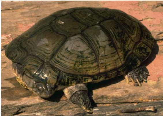
Abb. 6: Starrbrust-Pelomedusenschildkröte Pelomedusa subrufa olivacea .