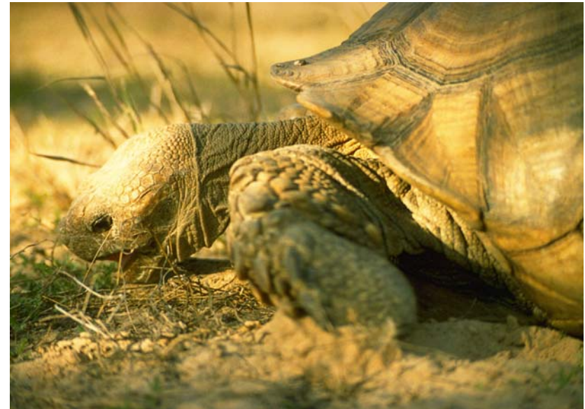
Abb. 17: Das Nahrungsangebot für die Spornschildkröten ist karg.