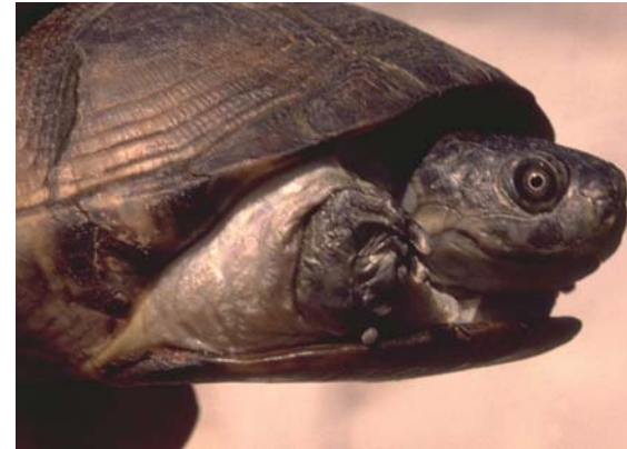
Abb. 10: Portrait einer Pelusios castaneus .