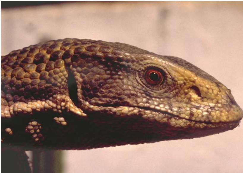
Abb. 23: Portrait eines juvenilen Steppenwarans Varanus exanthematicus .