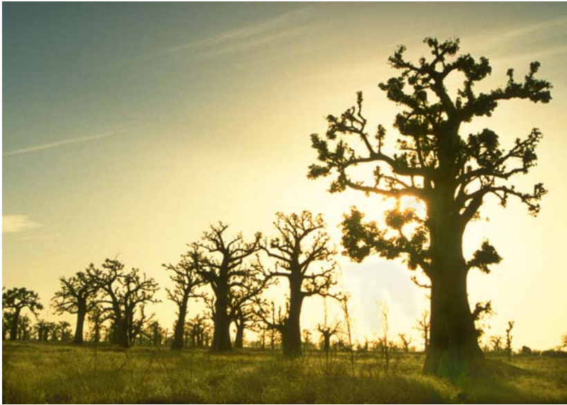
Abb. 2: Der «Wald» von Noflaye mit den typischen Baobabs in der Abenddämmerung.