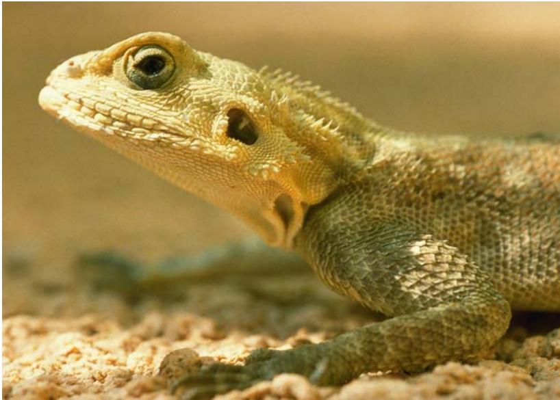
Abb. 18: Als Kulturfolger ist die Siedleragame Agama agama häufig anzutreffen.