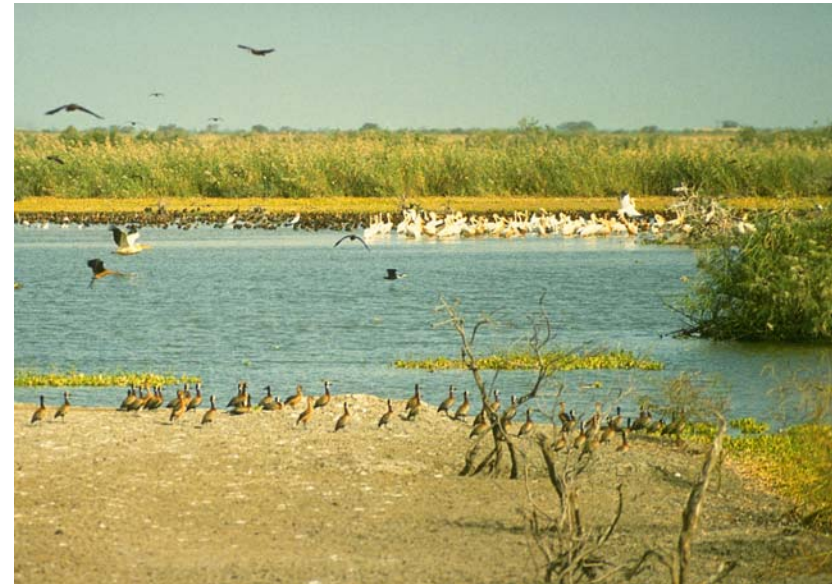
Abb. 12: Wasservögel im Djoudj Nationalpark.

Am Nachmittag führte uns die nächste Exkursion in das Guembeul-Reservat. In diesem Reservat werden in riesigen Gehegen die im Senegal durch die Jagd der ehemaligen Kolonialherren praktisch ausgestorbenen Damagazellen nachgezüchtet und für die Auswilderung in einem Nationalpark vorbereitet (Abb. 14). Neben den Gazellen gibt es aber auch mehrere Riesengehege für die Spornschildkröte (Abb. 15). Durch die Weite des Areals kann