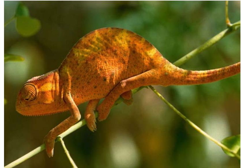
Abb. 20: Chamäleon Chamaeleo gracilis am Abend nach dem Auffinden in der Silvesterdekoration des Hotels.