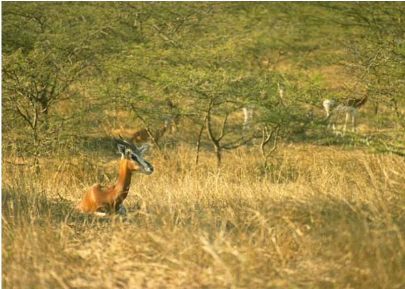
Abb. 14: Dama-Gazellen im Guembeul-Reservat.