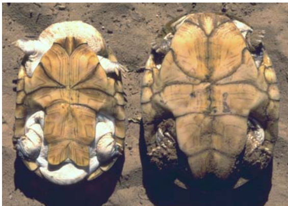
Abb. 8: Plastronansicht von Pelomedusa subrufa olivacea : links Männchen, rechts Weibchen.