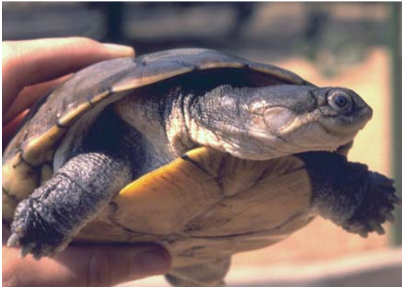
Abb. 7: Portrait einer Pelomedusa subrufa olivacea .