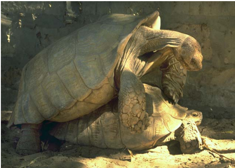
Abb. 3: Spornschildkröten bei der Paarung in der Station S.O.S Sulcata.