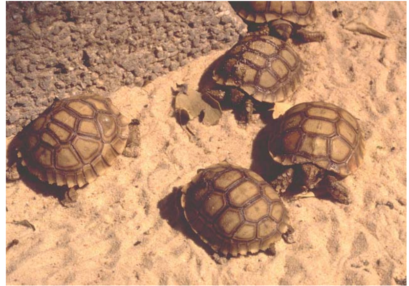
Abb. 4: Spornschildkrötenschlüpflinge in der Station S.O.S. Sulcata in Rufisque.