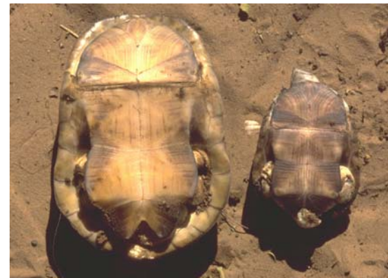
Abb. 11: Plastronansicht von Pelusios castaneus : links Weibchen, rechts Männchen.