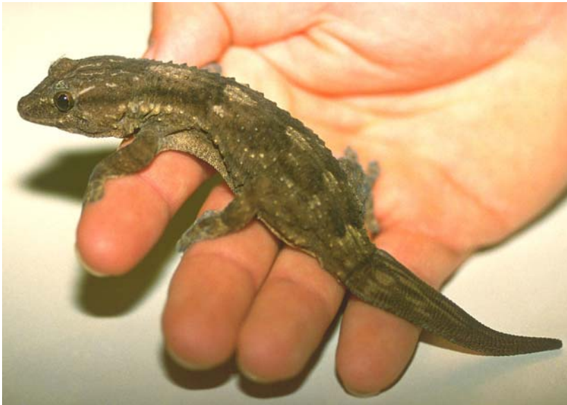
Abb. 19: Sattelgecko Tarentola ephippiata .