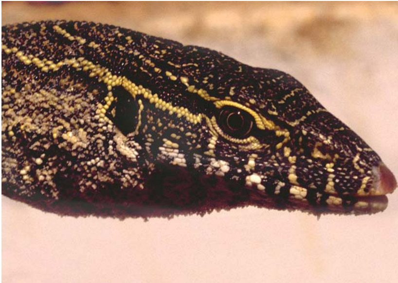
Abb. 22: Portrait eines juvenilen Nilwarans Varanus niloticus .