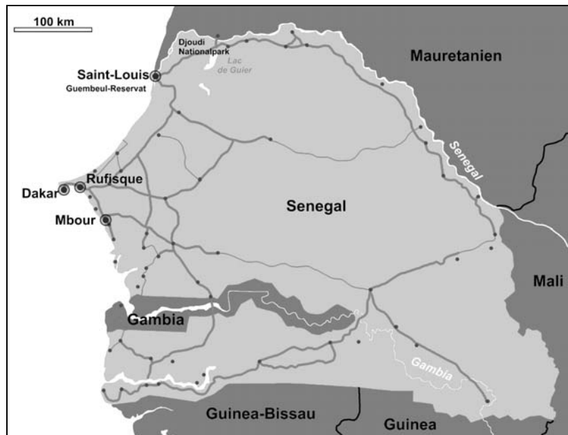
Abb. 1: Karte des Senegal.

Wir sind dann um ca. 20.00 Uhr in Dakar gelandet und haben uns zuerst um ein Hotelzimmer für die erste Nacht gekümmert.