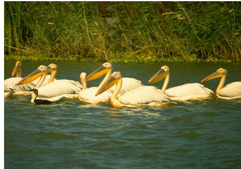
Abb. 13: Rosapelikane und ein Kormoran im Djoudj Nationalpark.