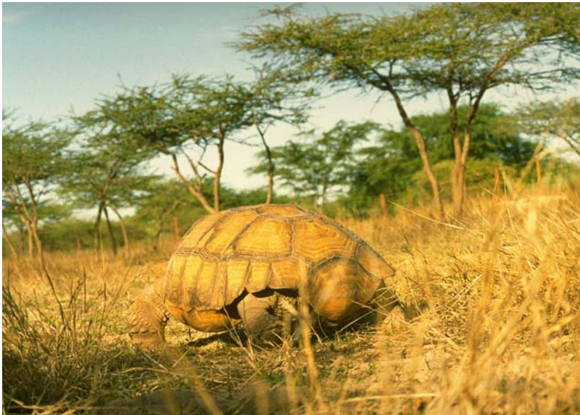
Abb. 15: Spornschildkröte im Guembeul-Reservat.